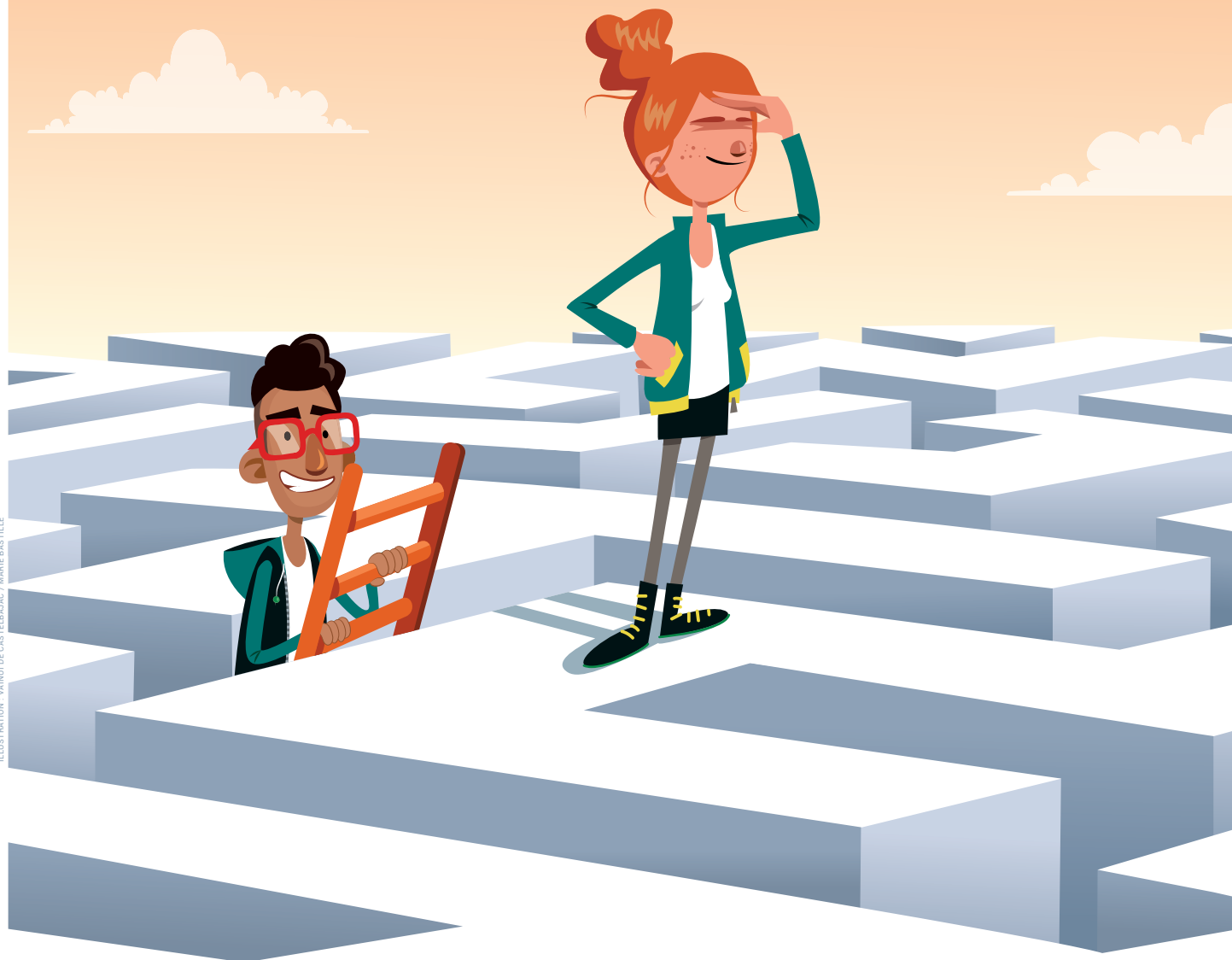
ILLUSTRATION : VAINUI DE CASTELBAJAC / MARIE BASTILLE

AVEC #MAMMISSIONLOCALE je décide de mon avenir!